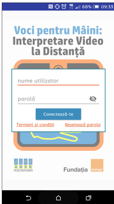
Ecranul de autentificare în versiunea „Android”.