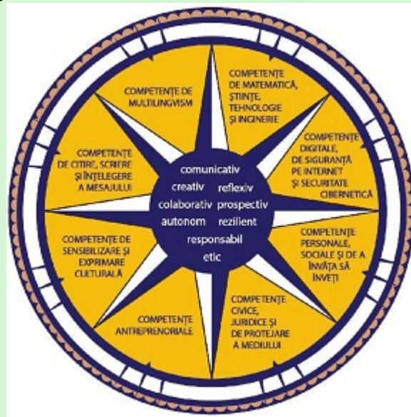
Figura 1*). Dimensiuni principale care contribuie la definirea profilului de formare al absolventului

Profilul de formare al absolventului funcționează ca o busolă pentru întregul sistem educațional, în care elementele continuumului predare-învățare-evaluare conlucrează pentru realizarea idealului educațional definit în lege.