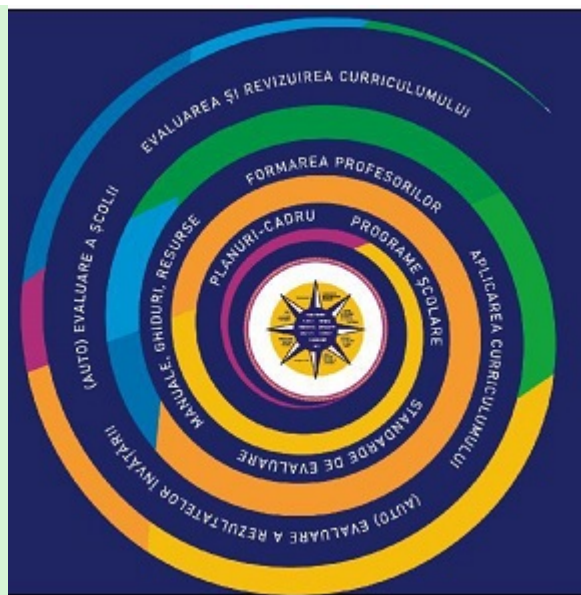
Figura 2**). Continuumul predare-învățare-evaluare

**) Figura 2 este reprodusă în facsimil.